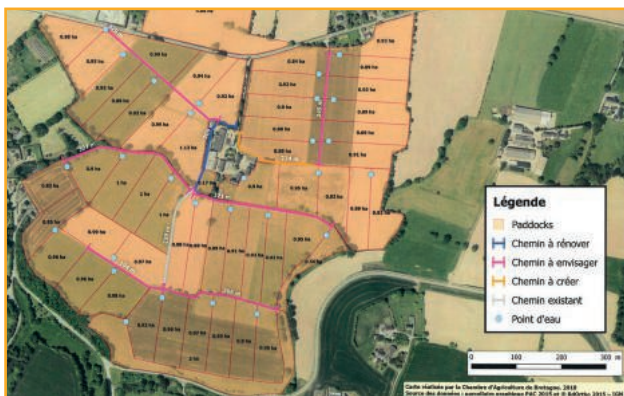
Fig. 2. Exemple d'aménagement du parcellaire en élevage laitier

Aide de 25 % à 35 % sur un plafond d'investissements éligibles de 15 000 €.